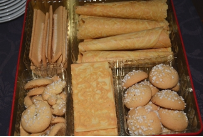
Julekaker hører med