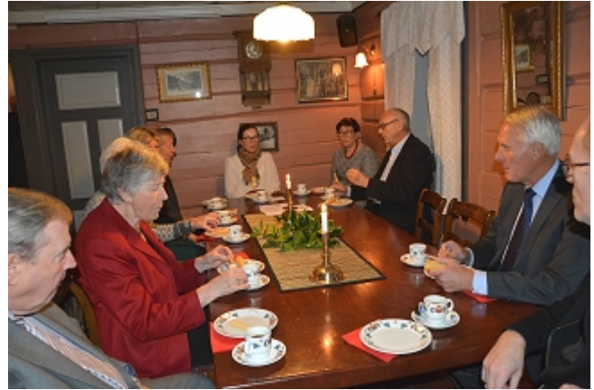
Stemming rundt bordene..