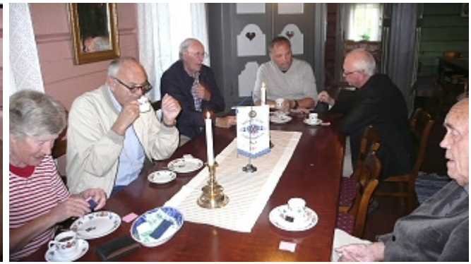
Samling ved kaffen