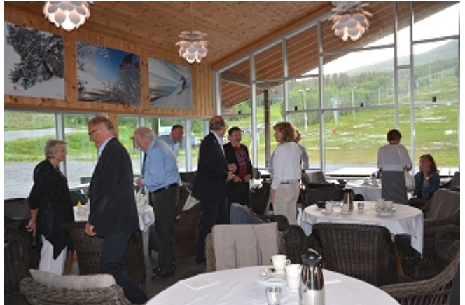
Takk for laget