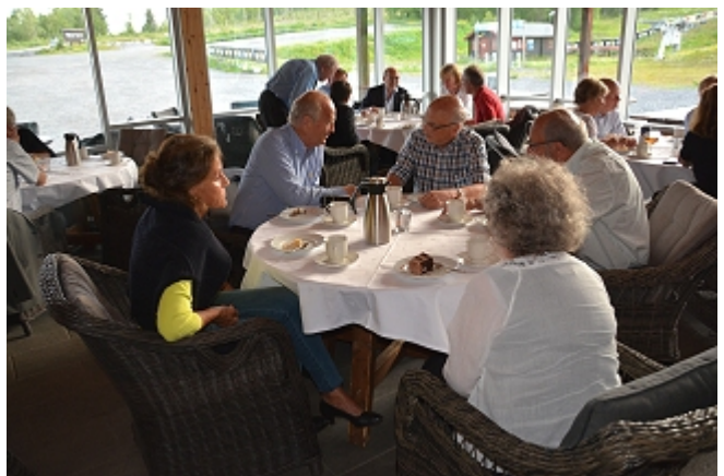
Stemning i salongen