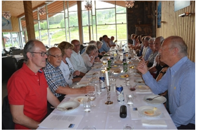
Det er servert