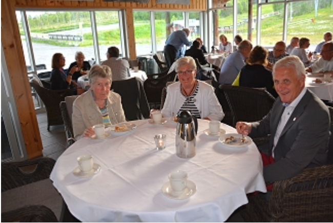
Smaken av bløtkake