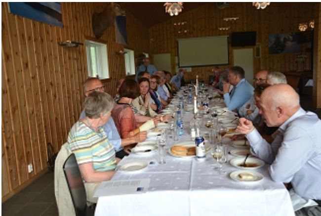
Det smaker med suppe