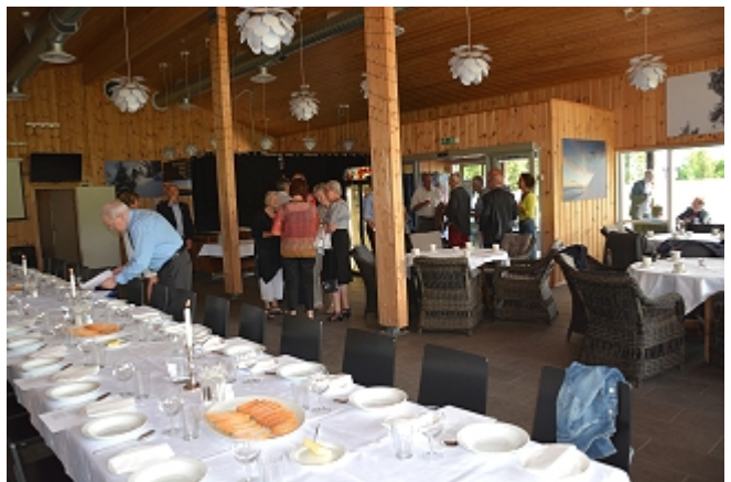
Den siste finpussen