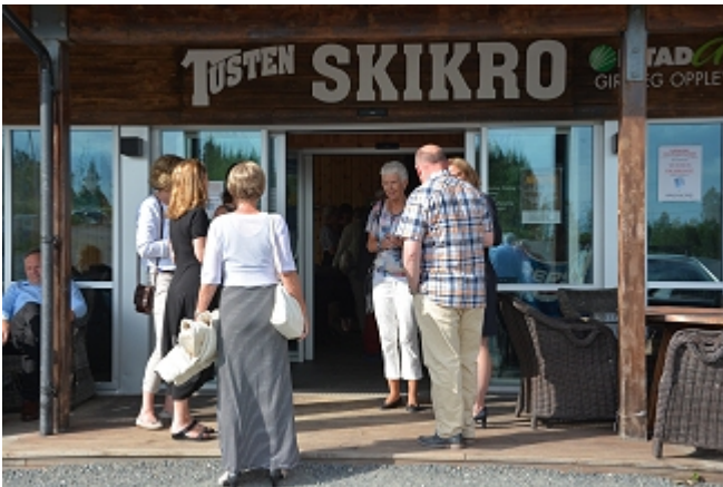
Her er stedet