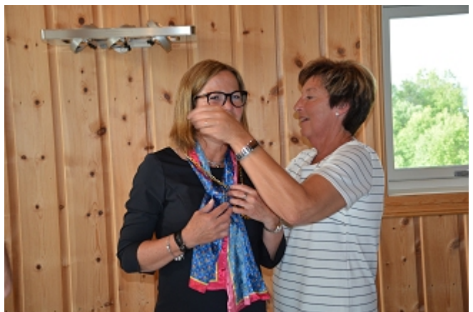
Kjedet er på plass