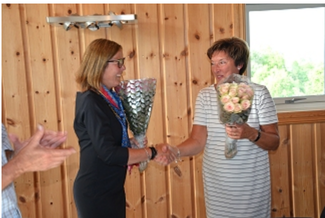
Roser og håndtrykk