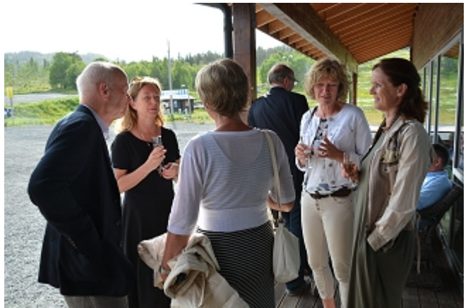
- der vi møttes