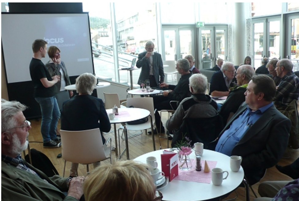
Publikum fyller opp