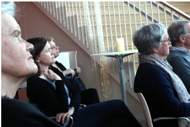
Nærbilde i salen