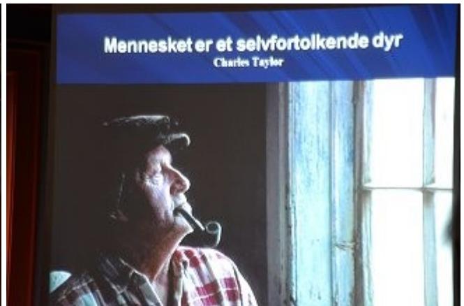
Et par illustrasjoner fra foredraget