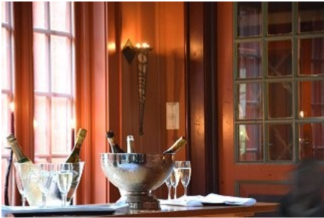
Velkommen til gards