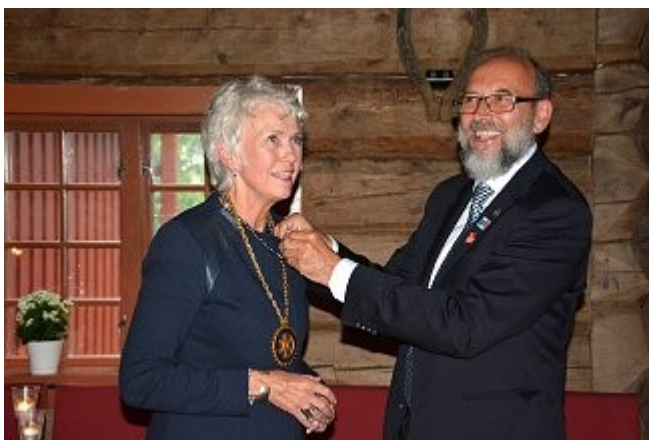
Nåla festes på nypresidenten