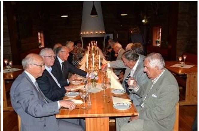
Vi benker oss ved bordene