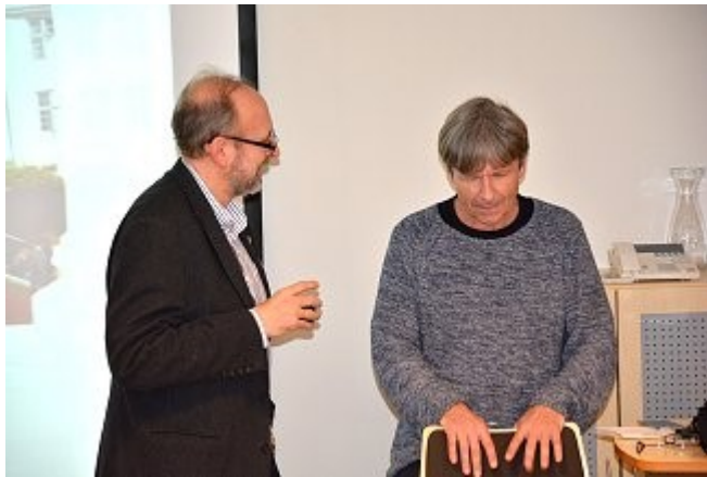
President og rektor