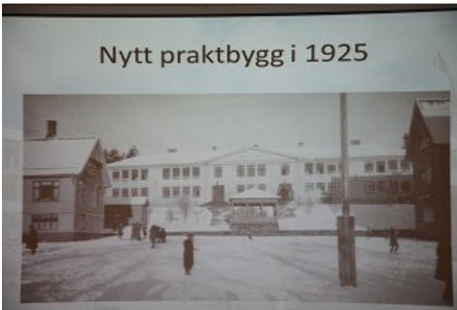
Nybygget fra 1925