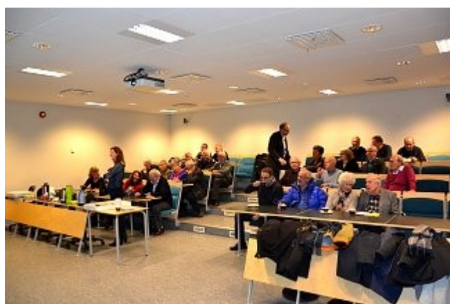
Tilhørerne finner sine plasser