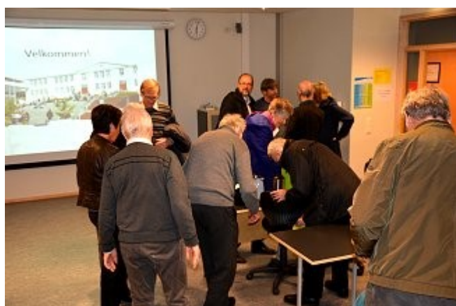
Kaffe og kringle først