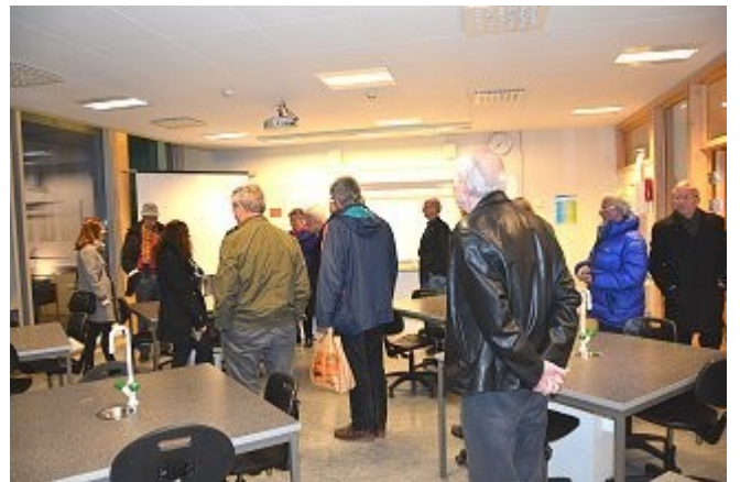
Omvisning i fysikkrommet