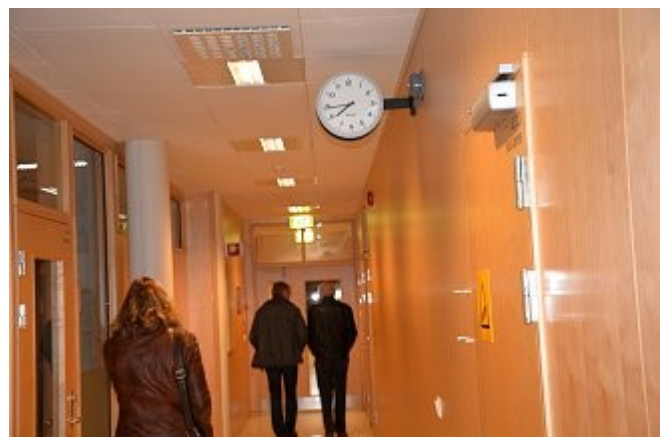
Takk for oss