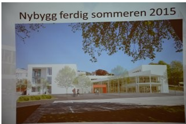
Påbygg ferdig 2015