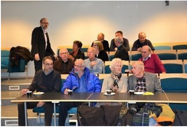
Spente rotarianere på første rad