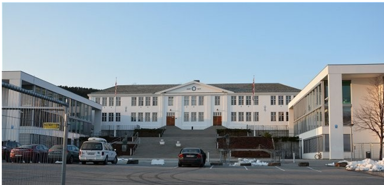
Molde videregående skole