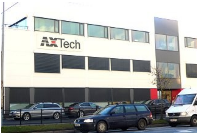
Nybygget på Fuglset