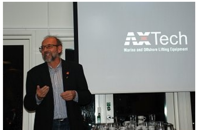
En glad president