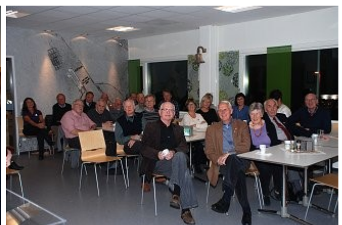
Alle på plass