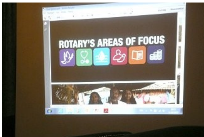
De 6 satsningsområder