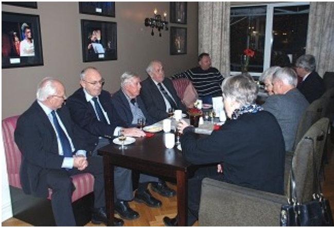
Forventninger å spore