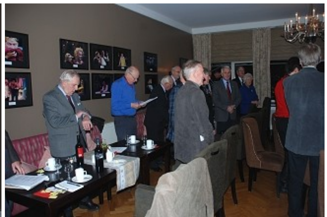
"Deilig er jorden"