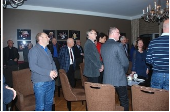
- og forsamlingen reiser seg