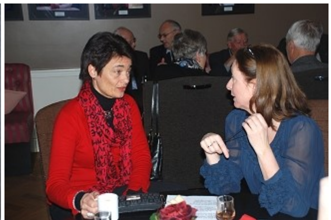
Vi skulle gjerne visst...