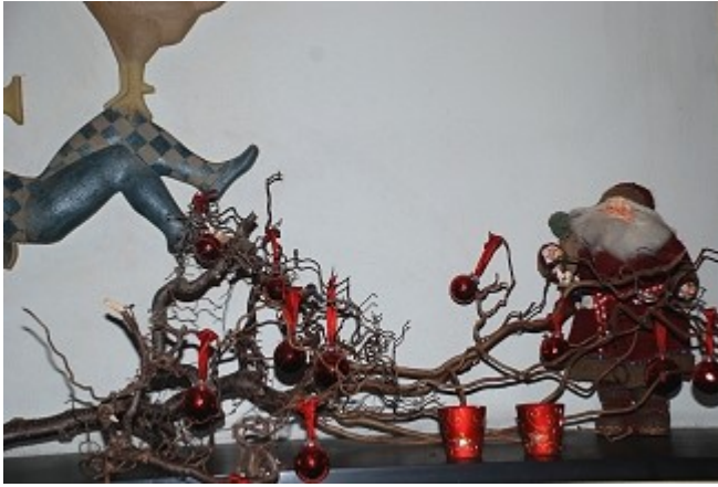
Julestemning på hotellet