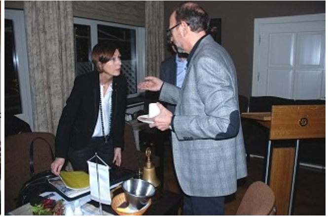
President og innkommende