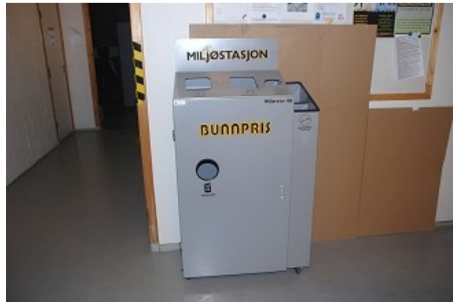
Et kjent produkt fra bedriften