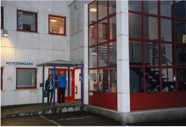
Hovedinngangen på Bergmo