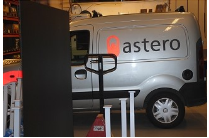
Den nye logoen