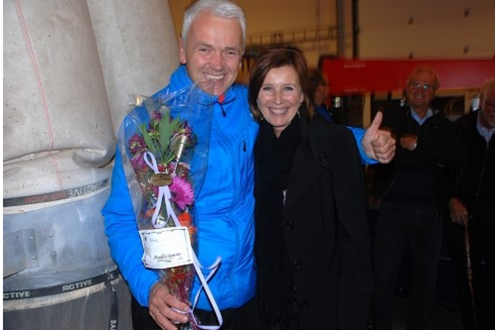
Direktør og president i skjønn forening