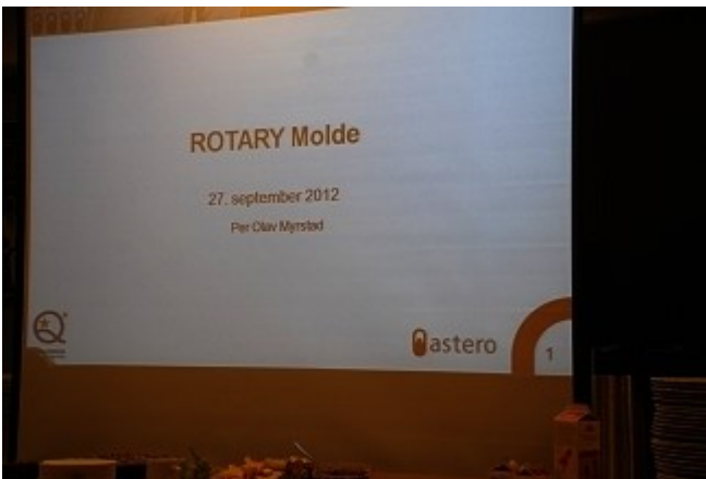
Presentasjonen er i gang