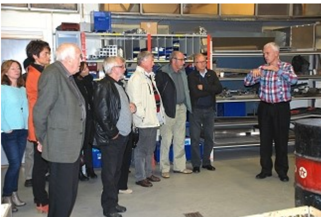
Omvisning i Bergmo-lokalene