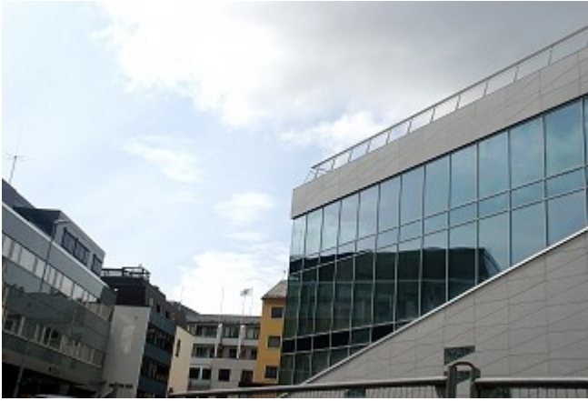
Detalj fra nybygget på Gørvelplassen