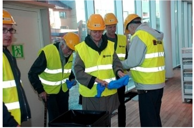
Hjelm, vest og sko-overtrekk hører med. Bjørnager nr. 2 fra h.