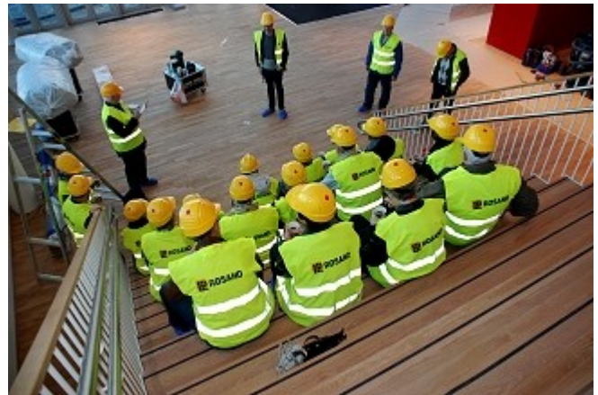
Omvisningen kan starte