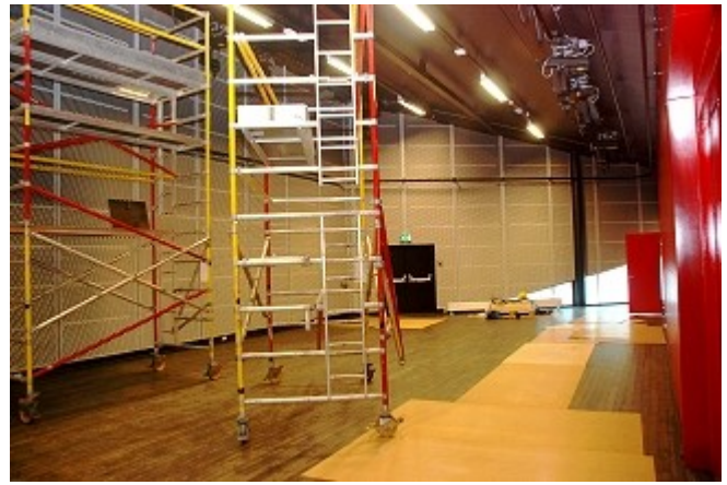
Utsnitt fra Storyville-salen