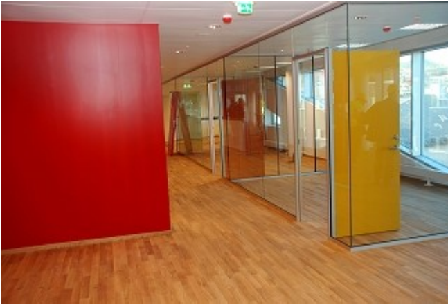
Administrasjonen i 4. etasje