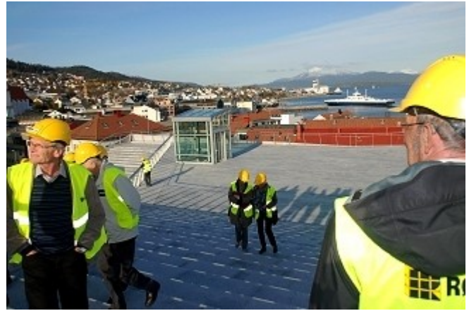
På byens tak