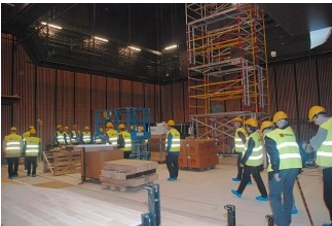
Fra teatersalong med scene, snoreloft og amfi. Røde stoler kommer.