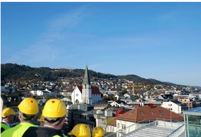
"Kirken, den er et gammelt hus"